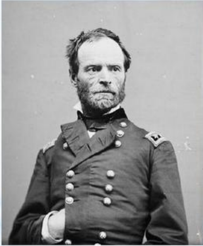
William Tecumseh Sherman /8 lutego 1820 - 14 lutego 1891