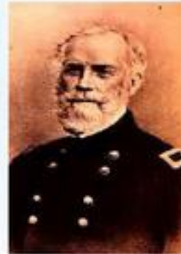
William Selby Harney