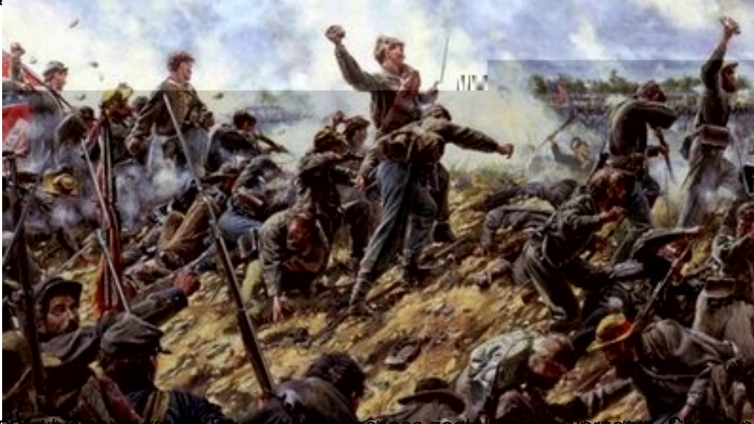
Walczyli pod murem w czasie bitwy pod Gettysburgiem, w czasie której...