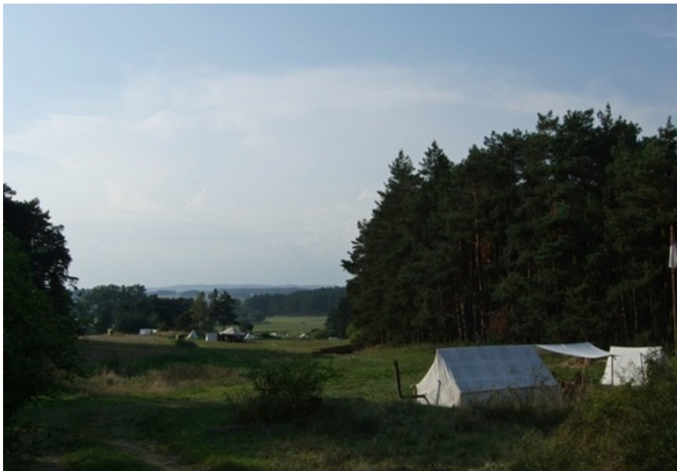
Historical reenactment site showing several white canvas tents pitched on a grassy field, with a tall flagpole to the right. The background features a dense forest of tall pine trees and rolling hills in the distance.