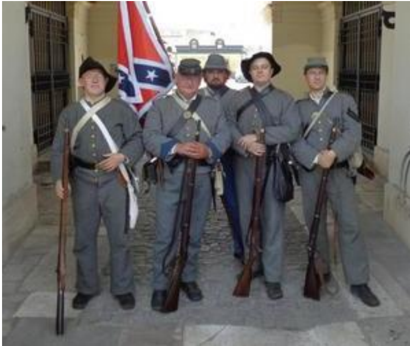
autor: Pogromca Siwków

Dnia 27 czerwca roku pańskiego 2014 nasz oddział wyruszył w kierunku Zamościa z pięknego Krakowa.