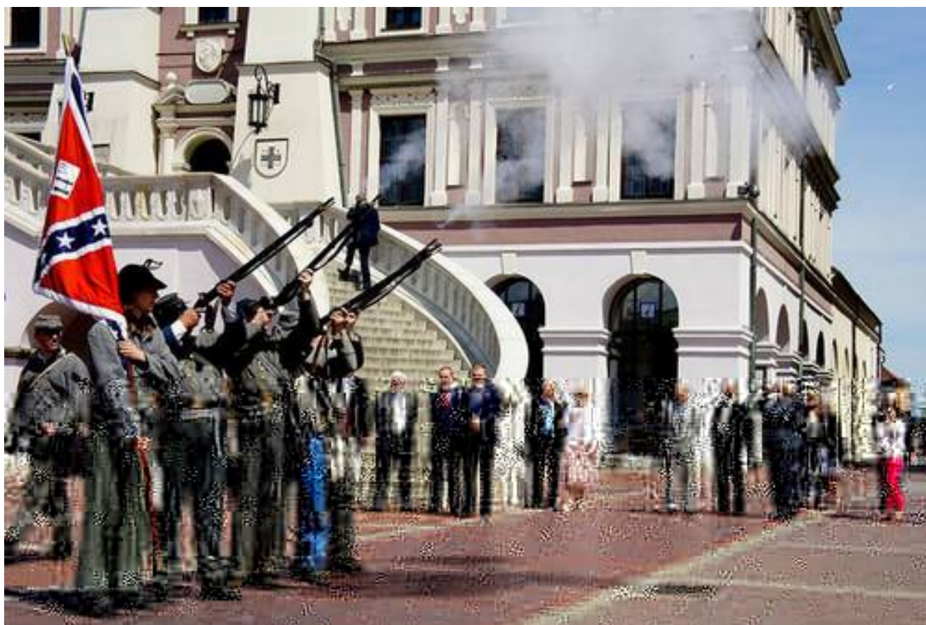
© 2014 by Zamojski Ośrodek Kultury i Dziedzictwa, Zamość, PL. All rights reserved. This content is excluded from our Creative Commons license. For more information, see http://ocw.org.pl/help/faq-fair-use/.