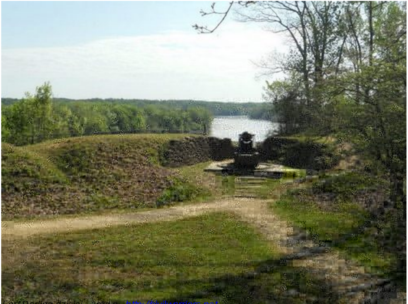
Fort Darling dzisiaj