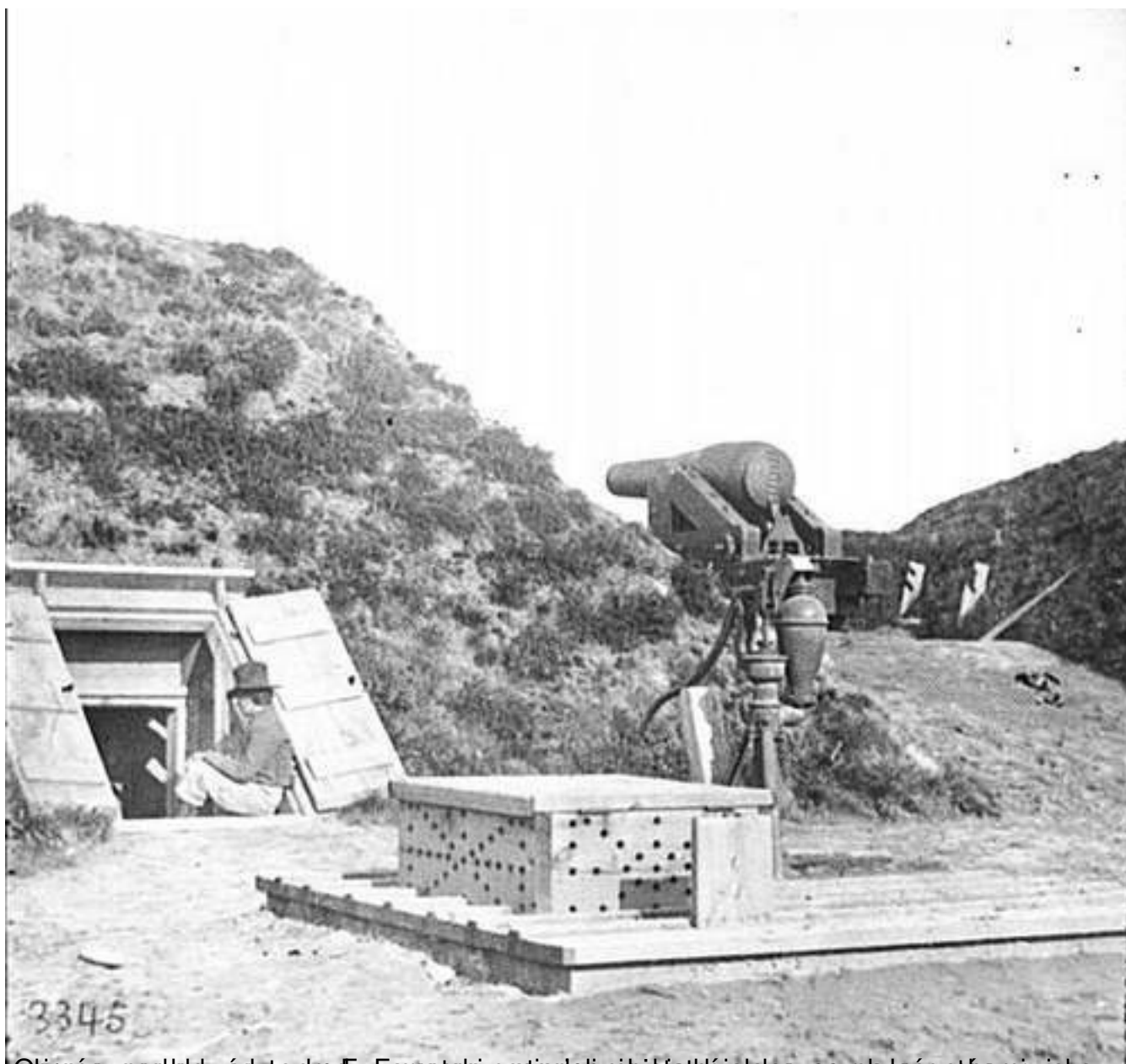
Obiekt przy wejściu do kwater. Wprost za nim znajdowała się jedna z czołowych części stanowiska