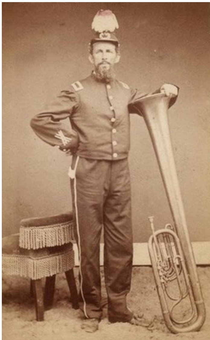
Photograph of a man in a military uniform standing next to a large brass instrument, likely a tuba or euphonium.