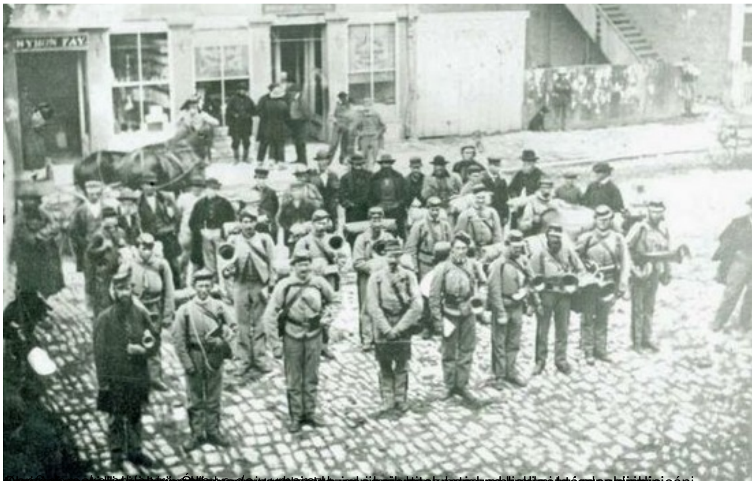
Wojna secesyjna w Stanach Zjednoczonych, 1862 r. Wzrost popularności muzyki w wojsku, w tym piosenek, które podnosiły morale i przetrwały do dziś.