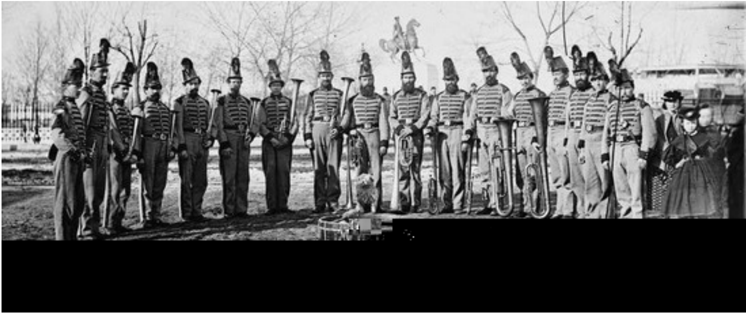
Washington, D.C. orkiestra 9 th Veteran Reserve Corps

szło do boju w takt muzyki granej przez orkiestrę.