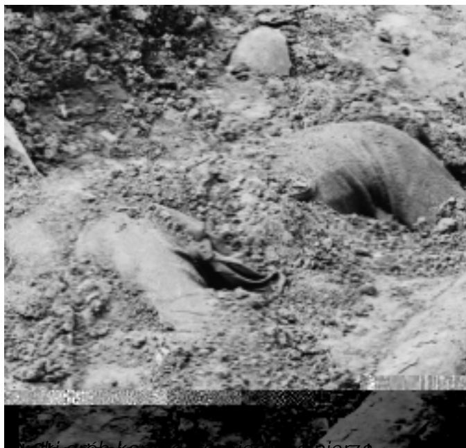
Wskazywanie na ciała żołnierzy, niebezpiecznych dla potrzebnych elementów związanych z walką.