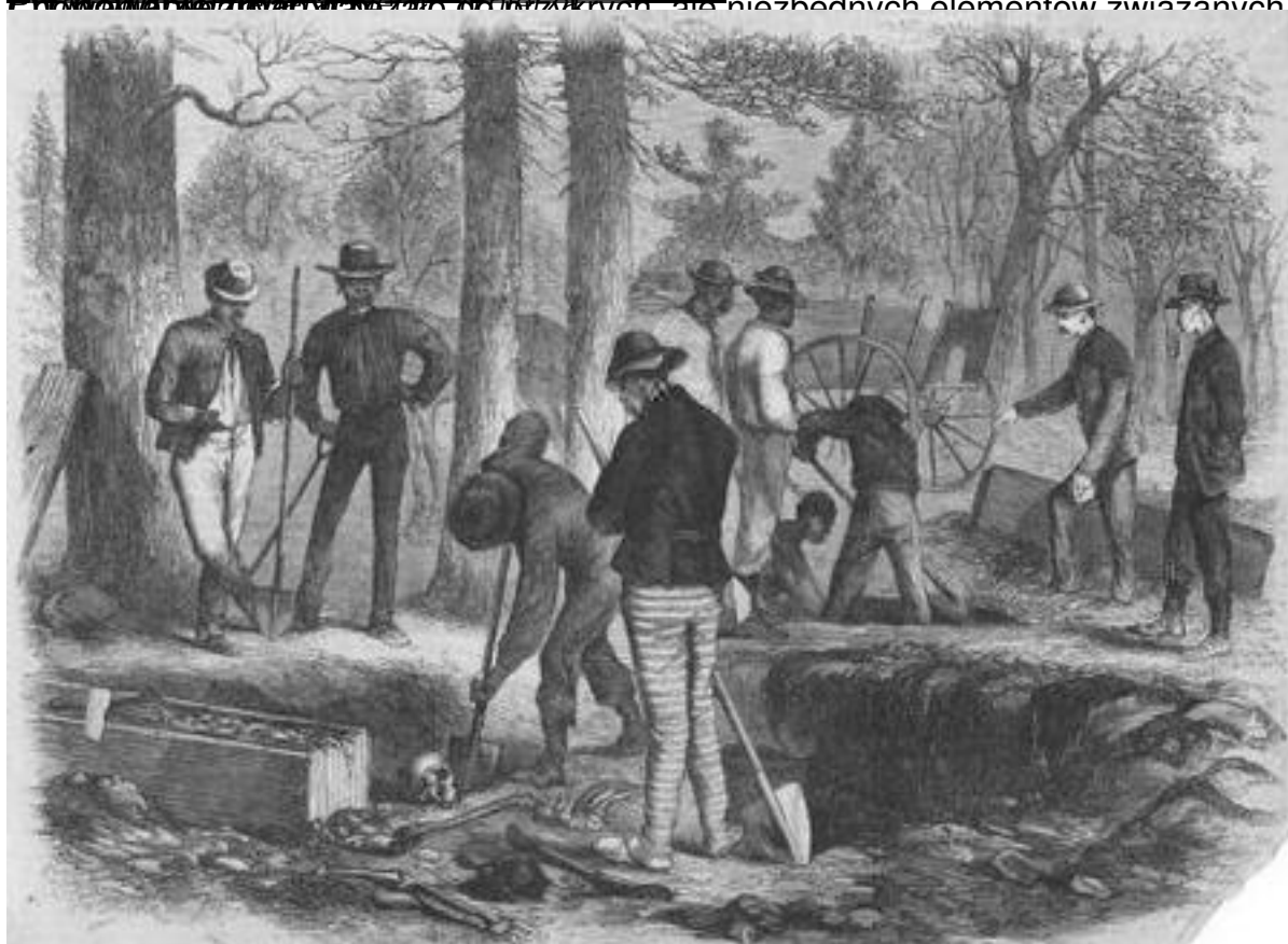
Wskazywanie na ciała żołnierzy, niebezpiecznych dla potrzebnych elementów związanych z walką.