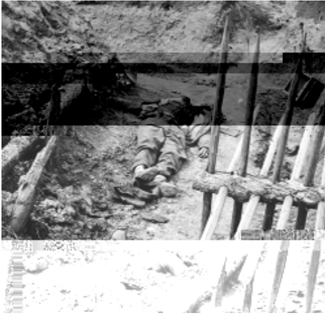
5. Sposoby reagowania na śmierć

Codziennosc obcowania ze smiercia sklaniala wielu generałów do zwrócenia się do Boga jako nadziei i pomocy w przetrwaniu horroru rzeczywistości, której doświadczali: