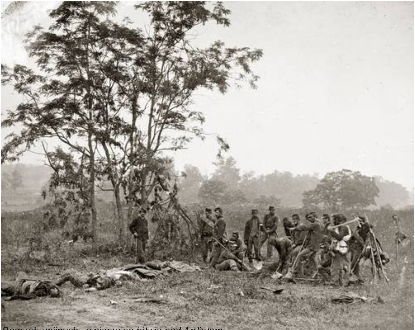
Pogrzeb unijnych, o nierzy po bitwie pod Antietam 4. Mistyczny wymiar śmierci

Jednym z bardziej interesujących zagadnień związanych z kwestią śmierci w czasie wojny jest przewidywanie przez niektóre osoby momentu swojego rozstania z tym światem. Generał John B. Gordon podaje kilka znanych mu przykładów tego fenomenu: