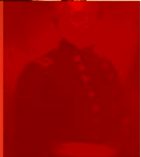
Henry Wager Halleck /16 stycznia 1815 - 9 stycznia 1880/