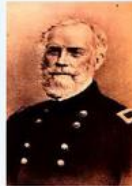
William Selby Harney