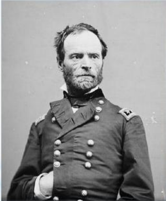
William Tecumseh Sherman /8 lutego 1820 - 14 lutego 1891