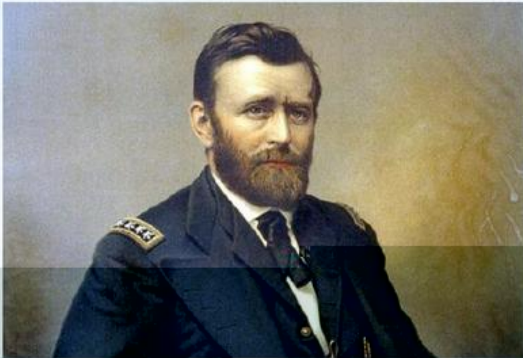
Ulysses Simpson Grant /27 kwietnia 1822 - 23 lipca 1885/