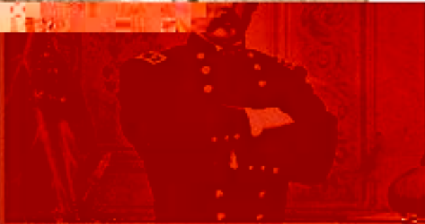
George Brinton McClellan /3 grudnia 1826 - 29 października 1885/