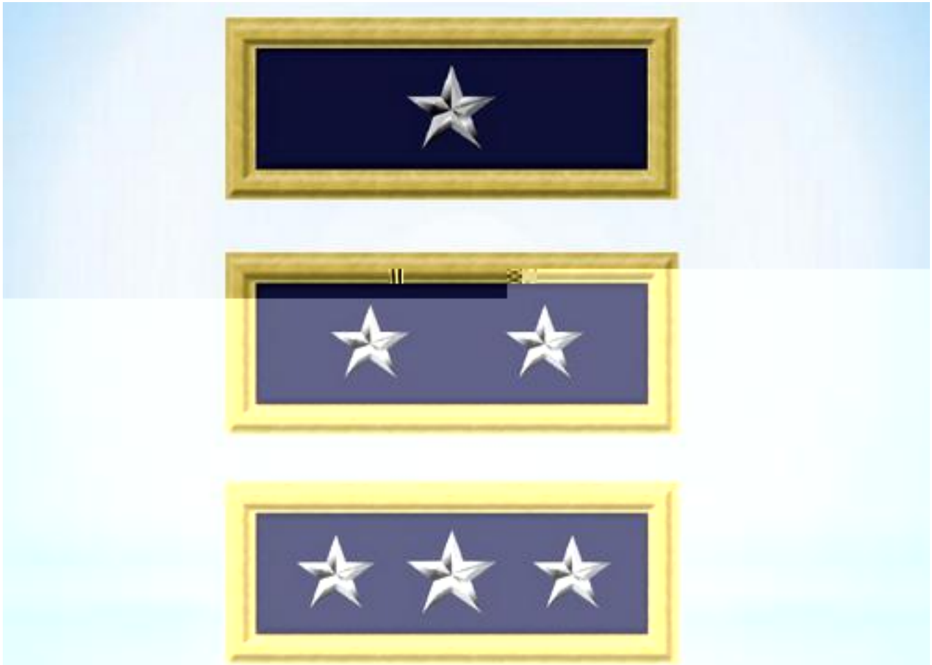
Naramienniki generalskie w armii Unii - od góry general brygady, general major, general porucznik

Przykładem jest tutaj naramiennik general brygady. Przykładem jest tutaj naramiennik general major. Przykładem jest tutaj naramiennik general porucznik.