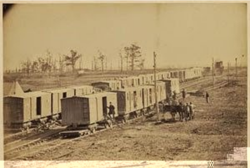
Photograph showing a long line of wooden buildings, likely tents or huts, set up in an open field. Several men are visible near the buildings, and a horse-drawn cart is positioned in the middle ground. The background shows a flat landscape with some sparse trees and utility poles.