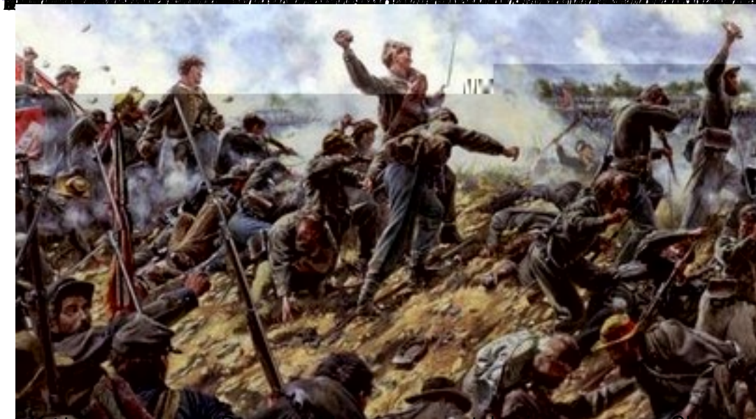
W czasie walki pod Gettysburgiem, 1 sierpnia 1862, w czasie