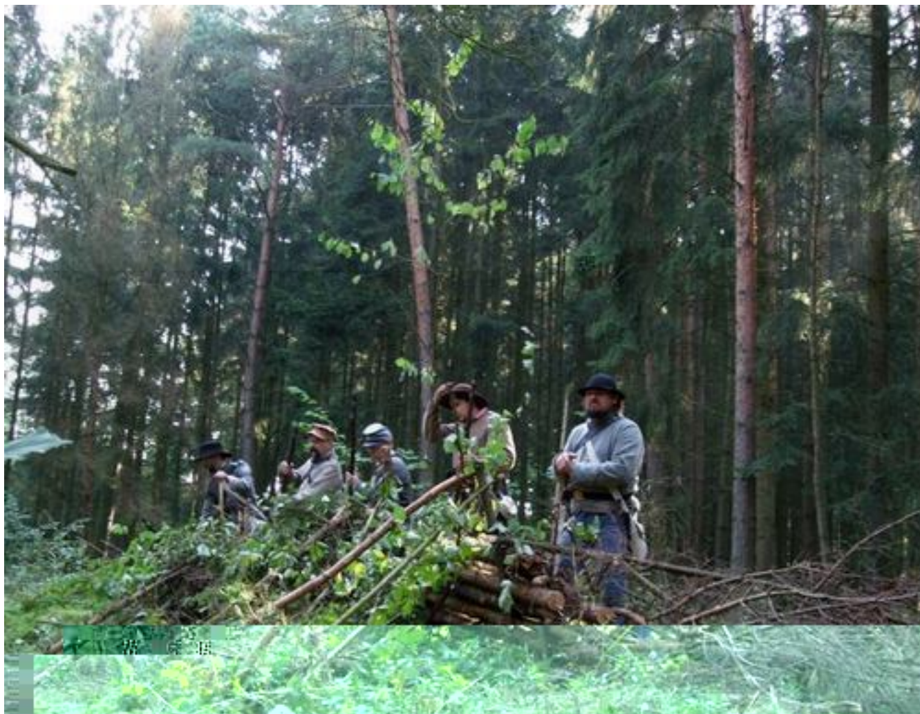
Przyjanieklesowata puze odgrodzimy by kazwataj z Alpa nia gówną linię obrony, odpieraliśmy