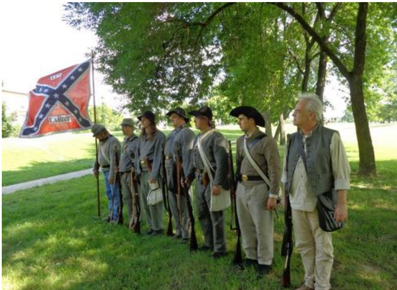
Stoją maszynę w parku wspaniale podziękowania Państwu. Dziękuję za organizację i stał się tożsaki pojawili