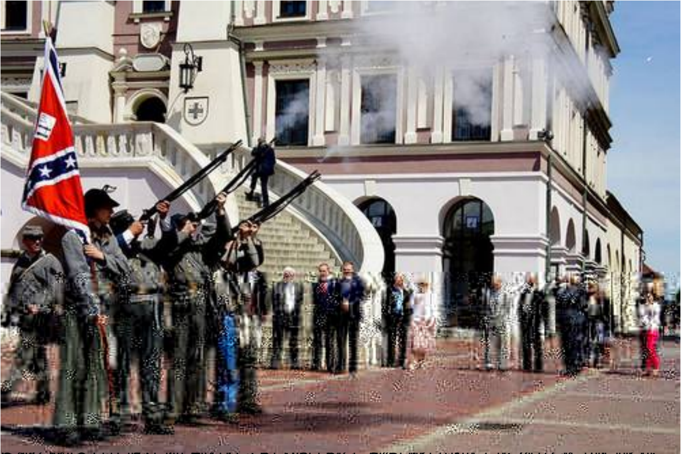
© 2014 by Zamojski Ośrodek Kultury i Dziedzictwa, Zamość, Poland. All rights reserved. This content is not to be used for any other purpose without the permission of the author.